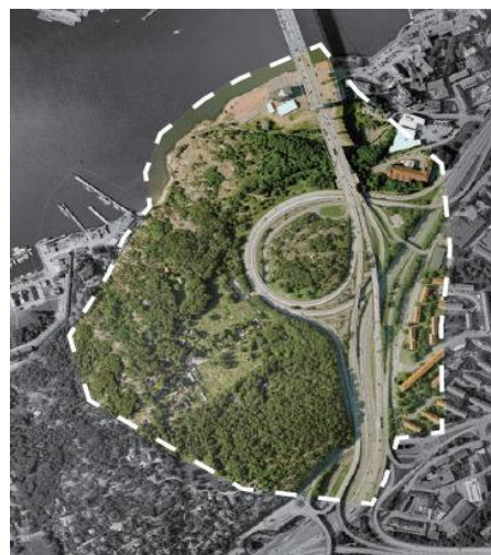
3. Programområde enligt BNs uppdrag