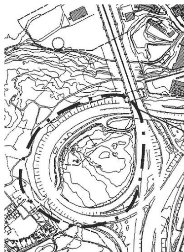
1. Område för markanvisning 2007