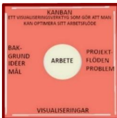
Figur 2. Obeyan Detta planeras för att bli effektivt. Förebild är nätverksbilder från Internet samt Staden Vi Vill Ha:s arbetsgrupp NPF-Ninjas förslag till ett så kallat demokratirum, för problemlösning som avses bli kärn-lokalen i framtida HASSP-noder och hubbar. Fondväggen upptar en kanbantavla med fält för "Att göra", "Pågående" och "Klart". KANBAN = "visuell signal". Obeyans viktigaste uppgift är att hålla ihop arbetsprocessen. Rummet kan ses som hjärnan i systemet.