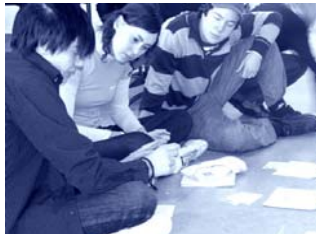
Fran Sveriges Ungdomsråds IRL-konferens i Dals Ed, nov -06

Trialogmetoden definierar inte bara i vilka frågor ungdomar kan och ska vara delaktiga, utan även på vilket sätt.