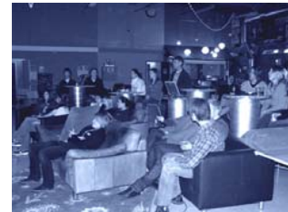
Järfälla Ungdomsråd och Trialog

Sveriges Ungdomsråd organiserar landets olika inflytandeforum, bl a genom att anordna den årliga IRL-konferensen (In Real Life...). Trialog deltog vid 2006 års konferens i Dals Ed och möttes enligt utvärderingen med stort intresse: