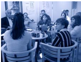
Barn och politiker i dialog...

För ett fruktbart samspel mellan beslutsfattande och ungdomsinflytande behövs dessutom levande mötesplatser - inte bara ungdomsråd, ungdomsfullmäktige eller liknande, utan även konkreta sätt att göra de yngre barnen delaktiga. I modellen som BUFF utarbetade görs även barn strax under tonårsåldern delaktiga genom de så kallade "buff-grupperna". Detta och andra sätt att låta "barns perspektiv", snarare än "barnperspektiv" färga av sig på de kommunala besluten är dessutom för den insiktsfulla första steg mot ett fungerande ungdomsinflytande.