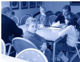
...på Barn- och ungdomskongress